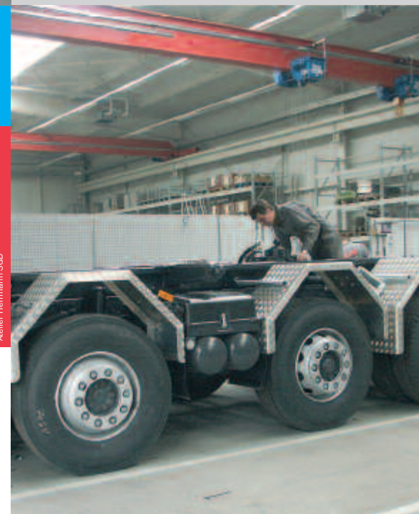
Atelier Hermann SGD

Convention collective de travail pour la branche de la carrosserie